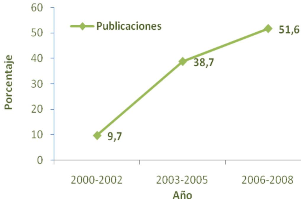
Figura 1. Publicaciones del grupo de salud mental. 2000-2008

Desde el año 2000 hasta el 2008, el grupo ha realizado 31 publicaciones en revistas indexadas y no indexadas, libros y capítulos de libros.